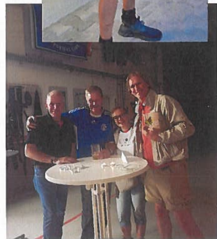
Impressionen von der Feier