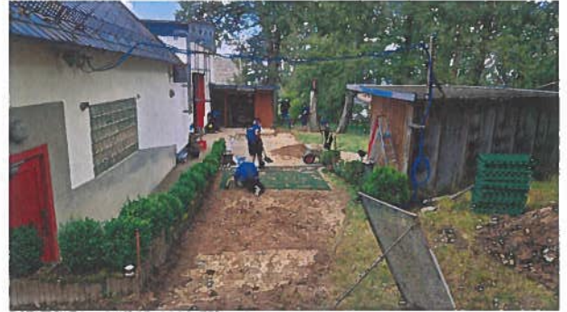
Optimierung unseres Festgeländes in den Rauschpenn